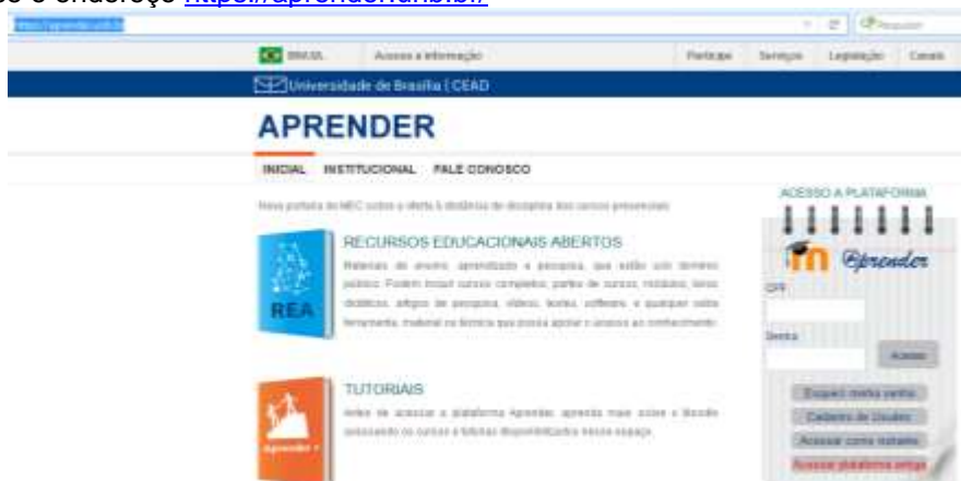
Figura 1 – Página para acesso a plataforma moodle.

Passo 1: Acesse o endereço https://aprender.unb.br/