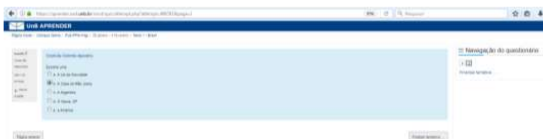
Figura 5 – Sala da prova com questões de para teste. Questão 2, Texto 1.