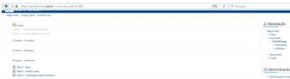
Figura 3 – Sala da prova com questões de para teste.

Passo 6 – Faça um teste preliminar. Na sala estarão disponíveis 03 Textos que permitem somente 01 tentativa. Teste-os. Contudo, lembre-se, que essas questões serão modificadas no dia anterior a prova. Durante a modificação os candidatos não terão a visualização das questões, que somente poderão ser visualizadas no horário da prova.